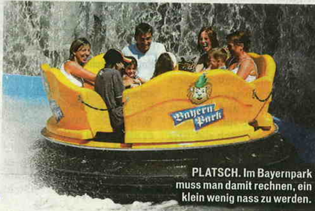
PLATSCH. Im Bayernpark muss man damit rechnen, ein klein wenig nass zu werden.