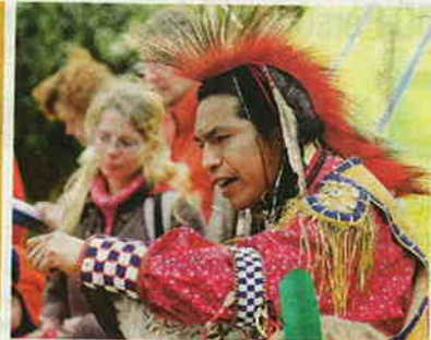
„U-U-U“. Jeder kann auf Schloss Schallaburg in die Rolle eines Indianers schlüpfen.