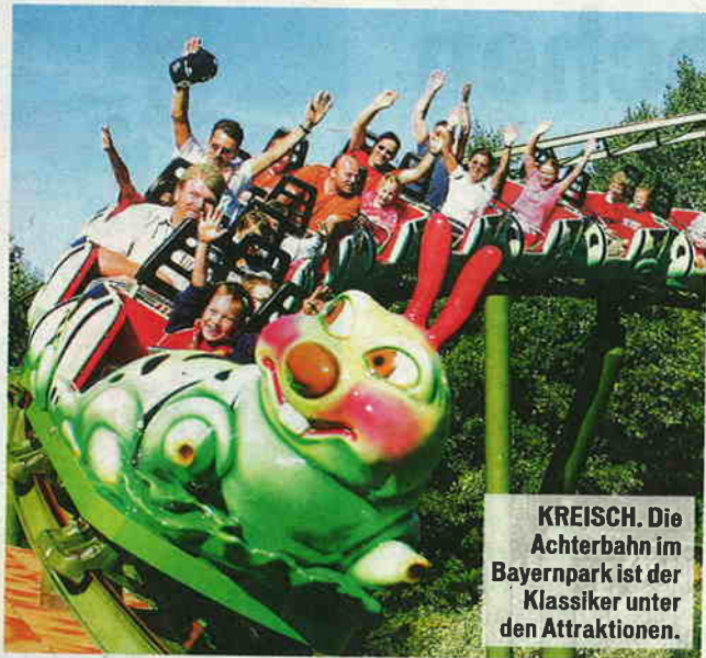
KREISCH. Die Achterbahn im Bayernpark ist der Klassiker unter den Attraktionen.